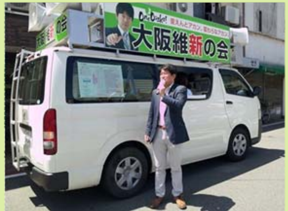
7月31日 区内街宣 街頭演説（スーパーナショナル前）